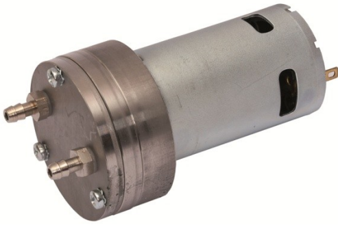
Abbildungen/Daten/Diagramme unverbindlich Illustrations/Dates/Graphs without engagement